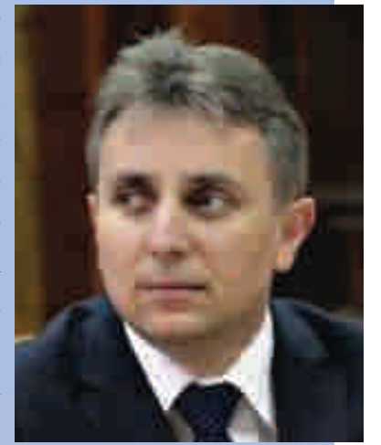
Lucian Bode, Ministrul Economiei, Comerțului și Mediului de afaceri

“Cred că relația României cu Rusia este una corectă, bazată pe respect reciproc și pe avantaje din ambele părți, în ceea ce privește relațiile comerciale. Sunt proiecte pe care noi urmărim să le dezvoltăm împreună, sunt companii mari care vin și se interesează de «Oltchim» Râmnicu Vâlcea. Ne-am întâlnit cu reprezentanții «Lukoil», într-o vizită oficială. Am văzut care sunt problemele cu care se confruntă - au o anumită problemă pe zona stațiilor de carburanți. Am discutat și cu ei, cum discut și cu cei de la «Petrom» și MOL, despre redevență, politica de prețuri etc. Deocamdată, cu marile companii din Rusia ne-am intersectat în sectoarele petrol, gaze, petrochimie. Există companii importante din Rusia, cum ați dat și dumneavoastră exemplu (n.r. «Gazprom»), care se interesează de aceste domenii. Dacă vom reuși să integrăm rafinăria «Arpechim», sunt convins că privatizarea «Oltchim» va fi un succes. Vom găsi un investitor puternic, care să ducă mai departe această companie importantă în România, dar care, din nefericire, este într-o situație dezastruoasă”.