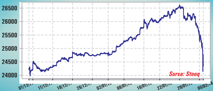
Grafic 2: Indicele volatilității VIX