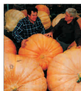
Culturile de organisme modificate genetic scapă de sub controlul Ministerului Agriculturii