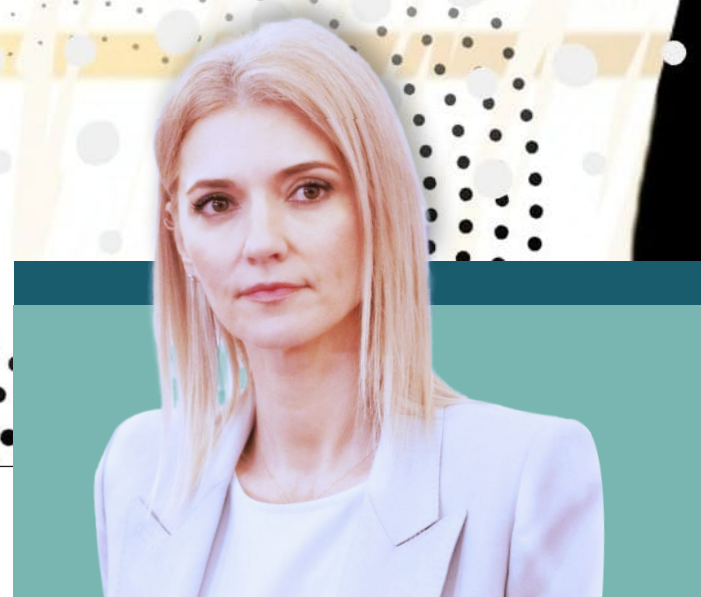
ALINA GORGHIU, Ministrul Justiției