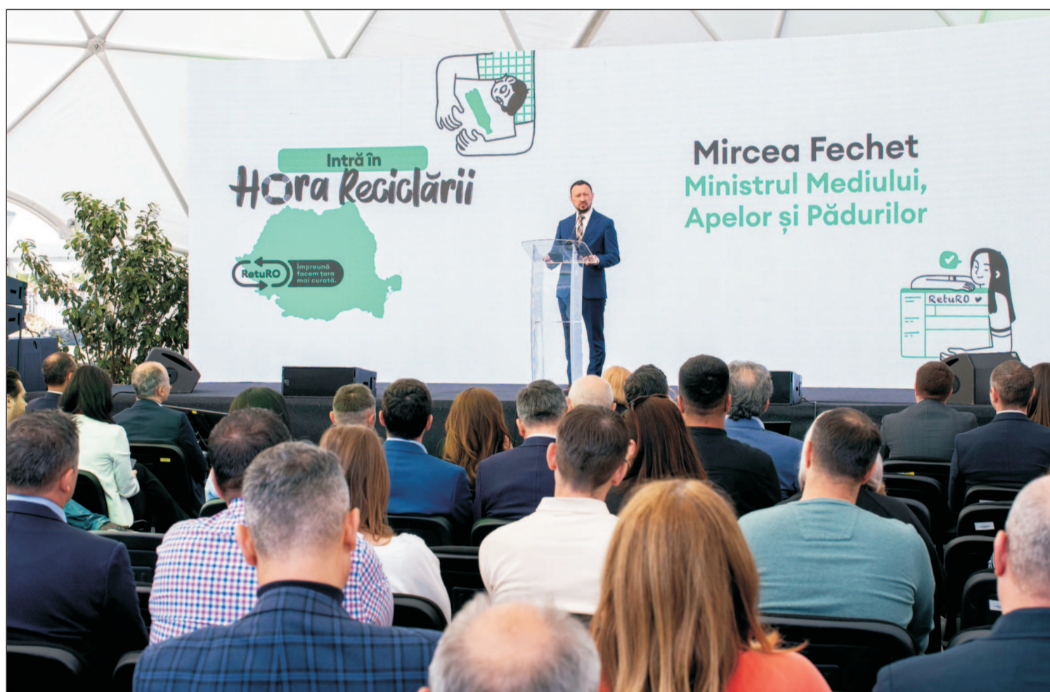
Mircea Fechet, ministrul Mediului, Apelor și Pădurilor: ”Am inaugurat, lângă București, la Otopeni, cel de-al patrulea centru de sortare și de numărare, un centru extrem de modern, cu o capacitate de șase tone în fiecare oră și care, dincolo de faptul că asigură infrastructura necesară pentru garanție - returnare pentru zona de sud, înseamnă în același timp și locuri de muncă”.

Vorbind despre reutilizarea ambalajelor, domnia sa a declarat: ”O sticlă poate fi reutilizată de 50 până la 60 de ori. Asta înseamnă că în loc să producem o nouă sticlă, să o topim la 1.100 de grade, spre deosebire de 1.800 când nu folosim material reciclabil, dar totuși... să consumăm atât de multă energie și să facem o nouă