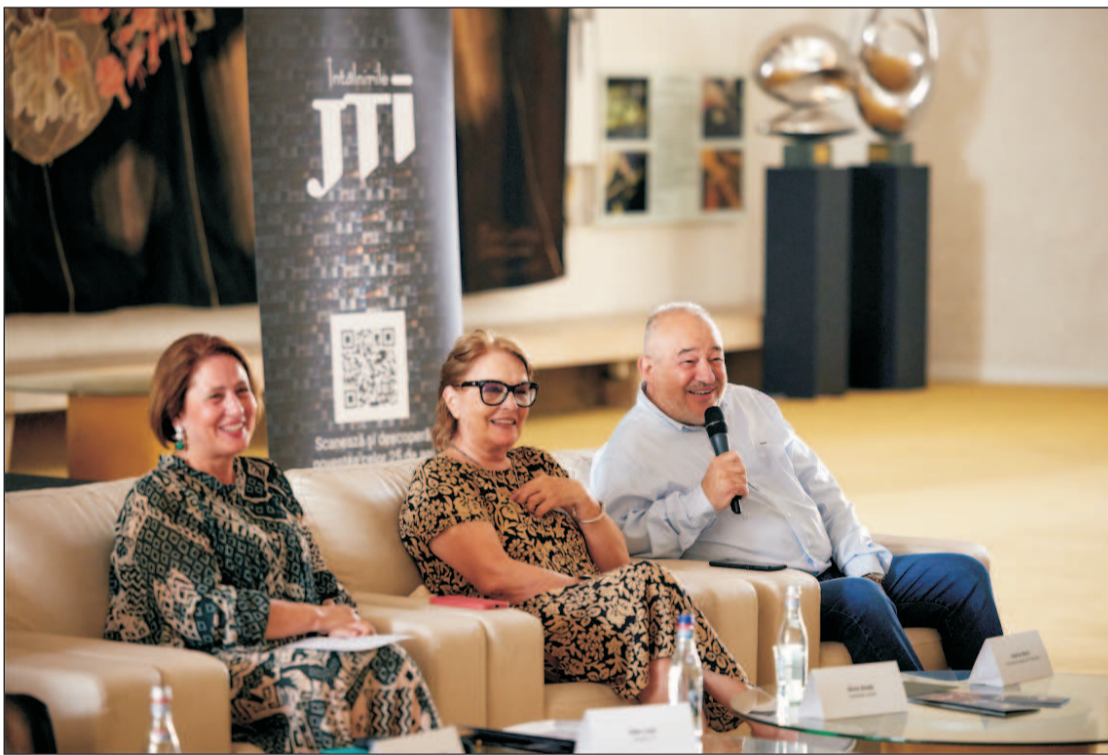
"De 25 de ani organizăm «Întâlnirile JTI», eveniment anual care a devenit un brand cultural național, sinonim cu excelența în dansul contemporan".

Croația - 125 de euro, cu diferențe semnificative față de țările vecine non-UE: în Serbia, acciza minimă este 90 euro, în Moldova 69 euro, iar în Ucraina 60 euro. În ultimul an, a apărut o nouă sursă în cercetarea Novel, și anume Bulgaria, care deține o pondere de aproape 20% ca proveniență a produselor de pe piața neagră, situație cauzată de acciza mai mică din țara vecină și de lipsa controlului vamal între statele membre