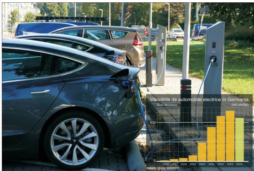
Vânzările de automobile electrice în Germania (mii unități)