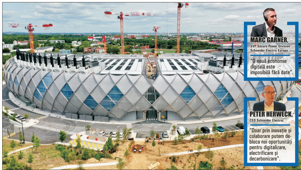
Centrul de date Digital Realty Paris