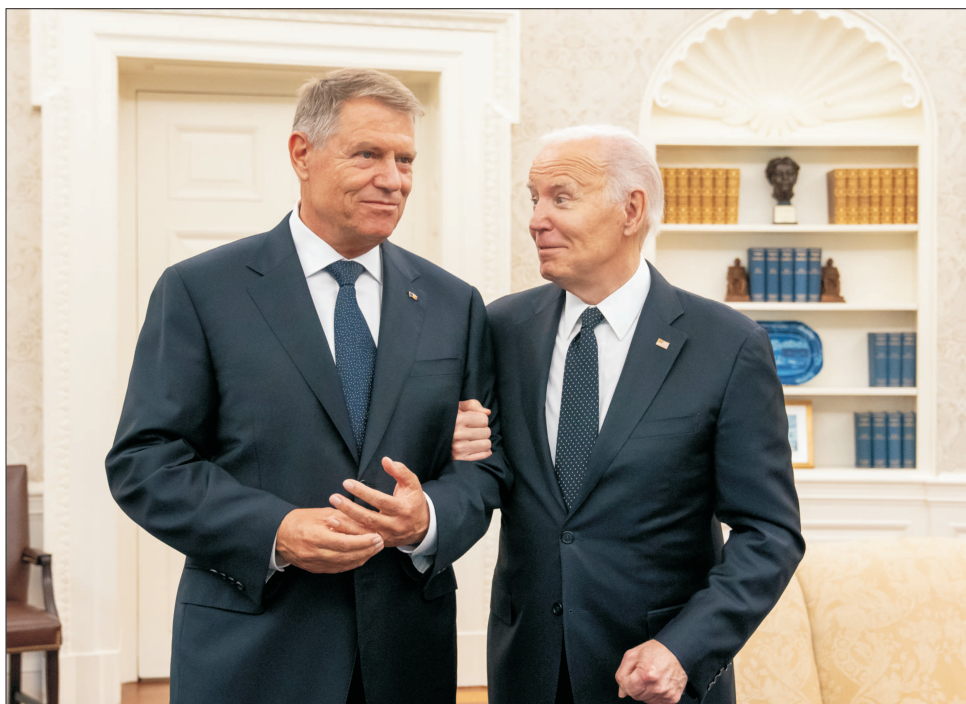
Președintele Klaus Iohannis (stânga) a avut, marți seara, o întrevedere la Casa Albă cu liderul american Joe Biden.