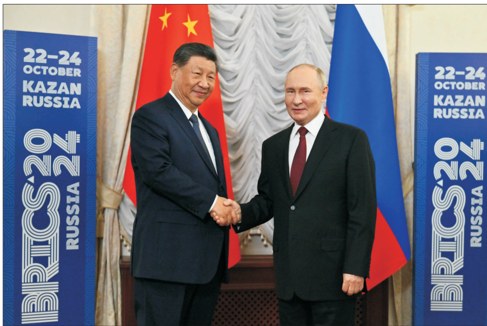
În cadrul lucrărilor BRICS, liderul Kremlinului Vladimir Putin (dreapta) a discutat, ieri după amiază, cu omologul său chinez Xi Jinping.

S tatele membre BRICS trebuie să ia mai multe decizii critice la summitul de la Kazan, cu scopul îmbunătățirii cooperării în cadrul grupului, a declarat liderul rus Vladimir Putin ieri, în prima zi a summitului BRICS pe care îl găzduiește.