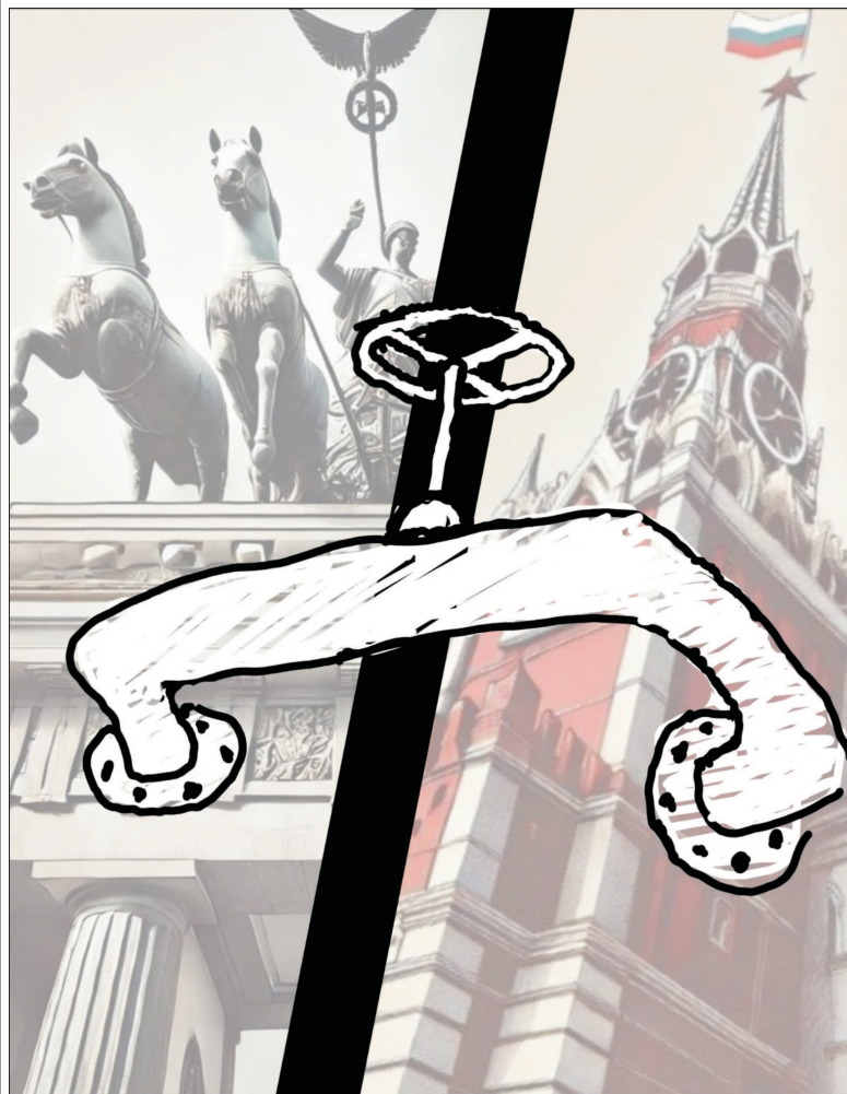
De aia-i gaz, ca să se-mprăștie... Ilustrație de MAKE