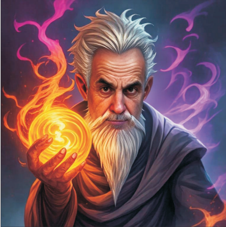
Ilustrație concepută de MAKE