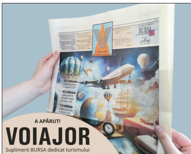
A APĂRUT! VOIA JOR Supliment BURSA dedicat turismului