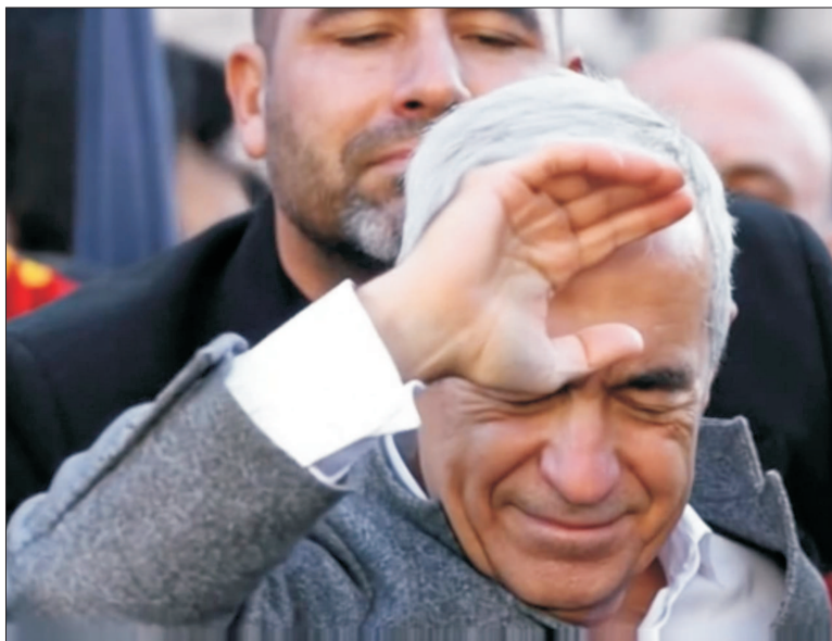
Ilustrație procesată artificial de MAKE

B iroul Electoral Central (BEC) a respins, astăzi, candidatura lui Călin Georgescu la alegerile prezidențiale din luna mai. Invalidează candidatura lui Georgescu fost votul de zece din cei 14 membri ai BEC.