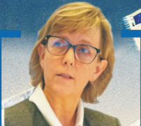
Maria Luis Albuquerque, comisar pentru servicii financiare și Uniunea de Economii și Investiții:

"Europenii sunt unii dintre cei mai buni economiști din lume, dar multe dintre economiile lor se află în conturi de depozit cu randament scăzut. În același timp, Europa se luptă să își satisfacă nevoile de investiții".