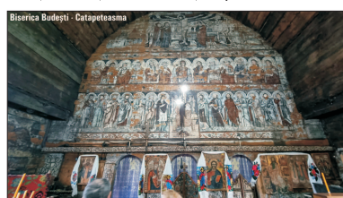
Biserica Bodești - Catapetesmasa

În muzeul "Țințaș", muzeograful Memorialul Victimelor Comunismului și al Rezistenței, ne-a spus: "Muzeul de la Sighet este o instituție a memoriei".