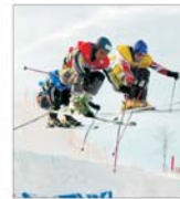
"Quicksilver" vrea să cumpere "Rossignol"