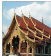
Stațiunile turistice din Thailanda vor putea să primească din nou turiști peste o lună