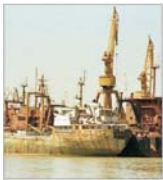
Investiții de perspectivă în valoare de 110 milioane euro în portul Constanța