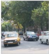
Prima de casare pentru automobilele vechi nu poate fi acordată momentan