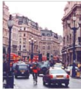
BCE anticipează o creștere de 4% a economiei mondiale, în 2005