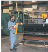
Exporturile "24 Ianuarie" SA Ploiești au crescut cu circa 50%. În ultimul an