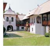
Gorj: dezvoltarea infrastructurii de acces către zona turistică - un proiect de 2,8 milioane euro