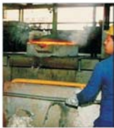
O treime din producția "Tornătoriei Centrale Orion" Câmpina se exportă