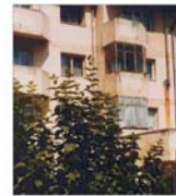
Tranzacțiile imobiliare vor crește cu circa 20% în fiecare lună