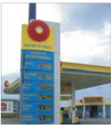
"Rompetrol Rafinare" - cifră de afaceri de 1,44 miliarde dolari în 2004