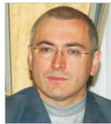
Hodorkovski a renunțat la toate acțiunile "Menatep"