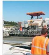
Cu banii de pe roviniete, CNADR ar putea construi 22 kilometri din autostrada Brașov - Borș