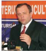
Proprietatea și absorbția fondurilor europene, prioritizate ministrului agriculturii