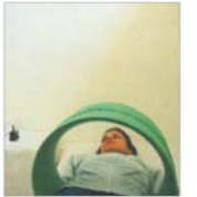
'Turism Felix' SA investește încă 6 milioane euro în complexul 'Internațional'