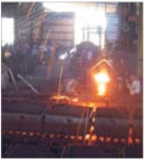
Siderurgii vor investi peste 500 de milioane de dolari ca să atingă standardele UE