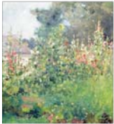
PLASAMENTE ALTERNATIVE Conuș și flori, în iarnă