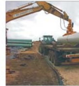
"Transgaz" caută constructori pentru extinderea rețelelor de gaze în Teleorman și Călărași