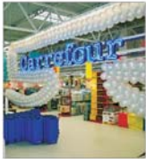
"Hyparlo" preia cu 100% controlul filialei sale din România