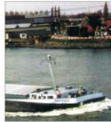
"Șantierul Naval Orșova" are, în acest an, 22 nave în program de livrări