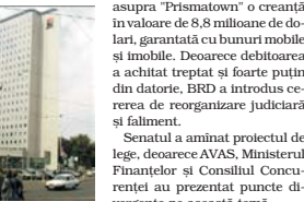
performante de la "BRD - Group Societe Generale". BRD deține

Consiliul Concurenței a primit, la sfîrșitul anului trecut, o sesizare de la Bruxelles care avertiza că preluarea de către Autoritatea pentru Valorificarea Activelor Statului (AVAS) a unei creanțe bancare poate fi apreciată drept ajutor de stat. Ieri, senatorii din Comisia pentru buget, finanțe și bănci au aminorat proiectul de lege pentru aprobarea Ordonanței de Urgență 127/2004, prin care fostul Guvern a aprobat preluarea de către AVAS a unor creanțe ne-