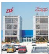
Compania Zapp va acoperi tot teritoriul țării