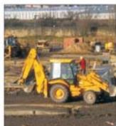
Începe viabilizarea terenurilor pentru tinerii timișoreni în zona Ovidiu Bălea