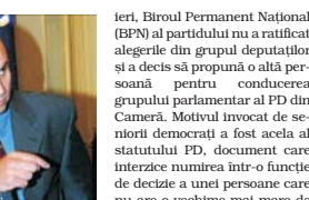
taților. Bucuria tînarului deputat PD a durat puțin, întrucît

Conflictul din interiorul PD, dintre "tabăra" Gușă și "veteranii" partidului, capătă amploare. Pe de o parte, se află Cozmin Gușă și cîțiva tineri democrați, iar pe de altă parte liderii cu state vechi de plată în partid, printre care se numără Adrian Videanu, Radu Berceanu și Vasile Blaga. Marți, Cozmin Gușă a fost votat, în ciuda opoziției lui Radu Berceanu - coordonatorul parlamentarilor democrați - în funcția de lider al grupului parlamentar PD din Camera Depu-