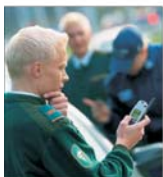
"Nokia" România vrea să elimine piața gri a telefoanelor