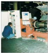
Investiții de 1 milion euro la "Arteca" Jilava