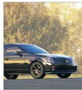
"General Motors" pune capăt parteneriatului cu "Fit"