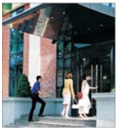
"A&D Pharma" planuește investiții de 13 milioane de euro în 2005