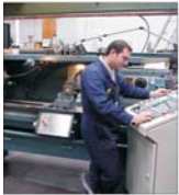
Fluxul investițiilor străine directe: 4,1 miliarde euro, în 2004