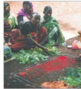
Banca Mondială lansează un program de 34 miliarde de dolari pentru țările sărace