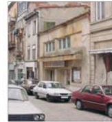
Primarul sectorului 3 cere interzicerea circulației rutiere în centrul istoric