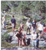
Fiscalitate zero pentru exportul de servicii turistice