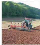
ADS are de încasat 3.000 de miliarde de lei