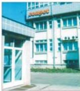
"Compet" Ploiești: vinzări de 60 de milioane de euro