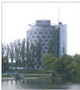
"Rometecom" va fi listată în 2006