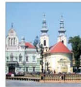
Locatarii clădirilor istorice ale Timișoarei sînt de acord cu programul de reabilitare