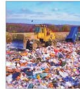
La Iași se va realiza o groapă ecologică de gunoi de 25 milioane euro