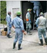
30 de mine vor fi închise și peste 6.000 de mineri vor fi disponibilizați!