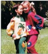
În acest an, la "Siretul Pașcani" sînt prevăzute investiții de 1,2 milioane de euro