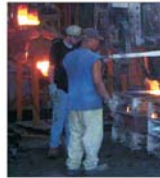
Cotațiile oțelului vor scădea în baza reducerii cererii din China