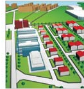
Prima etapă a realizării "Tehnopolis" se va încheia în luna aprilie