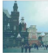
Investitorii străini se pling de corupția din Rusia