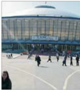
Tăriceanu trebuie să dea astăzi explicații privind separarea CCIRMB