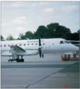
"Carpatair" își extinde operațiunile din țara noastră