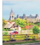
Posibilitatea construirii unei șosele de centură atrage investitorii la Iași