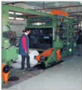
Conducerea "Mucur" estimează o cifră de afaceri de 60 miliarde lei pentru acest an