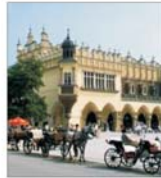
Starea de spirit a consumatorilor din Polonia se înrăutățește din ce în ce mai tare