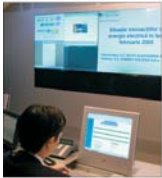
"Energy Holding" investește 2 milioane euro pentru Centrul privat de Management Energetic