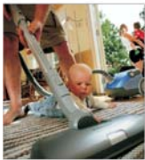
125 milioane de euro - cifra de afaceri a Electrolux România