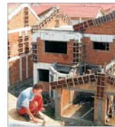
Patru firme sint interesate să construiască 400 de case in Brașov