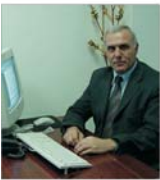
750.000 de euro pentru un nou spațiu "Midal"