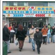
Fostul președinte al CNVM, Mirela Taruc, este anchetat în legătură cu privatizarea SC "Bucur Obor".

Procurorii din Parchetul Național Anticorupție (PNA) l-au pus, ieri, în mod oficial, sub invinuire pe fostul președinte al Comisiei Naționale a Valorilor Mobiliare (CNVM), Mirela Taruc, în legătură cu modul de privatizare și înstrăinarea a 7,4% din acțiunile de la SC "Bucur Obor" SA, în anul 2000. Procurorii anticorupției susțin că Mirela Taruc ar fi tranzacționat în mod ilegal pe piața Rasdaq acțiunile respective și li acuză de implicare în următoarele infracțiuni: șantaj, fals în înscrisuri sub semnătură privată, abuz în serviciu contra intereselor publice și împotriva intereselor persoanelor și folosire de informații confidentiale.