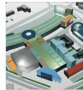
50 de arhitecți s-au înscris în concursul național pentru proiectarea ansamblului MADISON