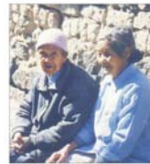
APAPR propune modificarea legislației privind sistemul privat de pensii