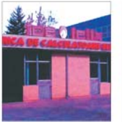
Pierderi de 22 miliarde lei la "ICE Felix"