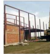
"FM Logistic" vrea 80.000 metri pătrați în Parcul Industrial Freidorf din Timișoara