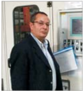
"Monte Bianco" vrea să-și majoreze cu 40% cifra de afaceri în acest an