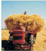
Ajuatoarele de stat din agricultura vor fi abandonate în 2007