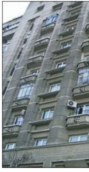
plata în euro. Un al doilea element care a putea perturba piața și care tine tot de psihologia vînzătorilor este trecerea la leul greu. Este posibil ca prețurile să aibă larași o evoluție ar-