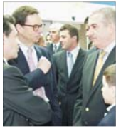
"Renault" continuă programul de investiții la "Dacia"