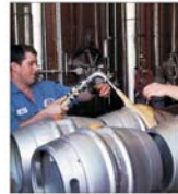
Marii producători de bere și-au făcut asociație