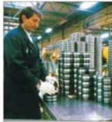
"Rumeniți" Bărlad - investiții de peste 26 milioane dolari în acest an