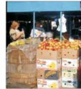
Investiții de 13 milioane euro în modernizarea centrului comercial Astra Brașov