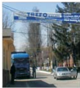
Un român conduce "Treo" Galați după modelul japonez