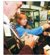
FM: Previțiuni optimiste pentru economia SUA