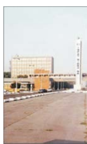
Ioane de euro, din totalul de 70 milioane de euro.

Investițiile de mediu pentru alinierea industriei la normele europene ne vor costa aproximativ 7 miliarde de euro, bani care vor trebui alocați până în anul 2015. Guvernul a reglementat ieri legislația în domeniul controlului emisiilor de gaze, conform angajamentelor asumate în domeniul protecției mediului.