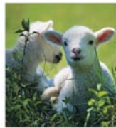
Mieii, ouăle, cozonaci și vinurile nu vor lipsi de Paște