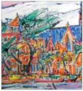
PLASAMENTE ALTERNATIVE Cu ochii pe prețuri și colecționari