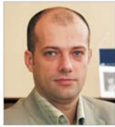
"Allied Telesyn" estimează pentru acest an vânzări de 5 milioane de dolari