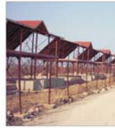
Cartierul ANL II din Căiaraș, între probleme și soluții

Cine își dorește speranță este cel mai sărac om din lume. Thomas Fuller