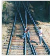
"Construcții Feroviare Cluj" are în atenție achiziția de lucrări la Culoarul IV Pitești - Arad