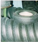
Piața anvelopelor se umplă