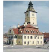
Planul de urbanism general al Brașovului, scos la licitație