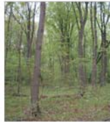
Exporturile „Romsilva” - în stagnare