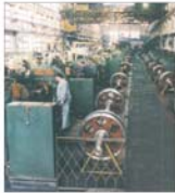
"Vulcan" București: investiții de 800.000 de euro