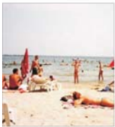
"Turism Transilvania": contracte de peste 320 miliarde lei pentru turismul balnear și cel de litoral