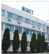
Directorul general al "Minet": "Nu ne deosebim cu nimic de o firmă occidentală"