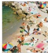
Turiiști străini caută pachete turistice care oferă excursii în țară