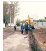
În Călărași a demarat Programul "SAMTID"