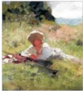
PLASAMENTE ALTERNATIVE Grigorescu, Țuculescu, Isărescu