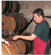
Săjalul așteaptă investitorii pentru producția vinurilor cu denumire de origine