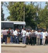
"General Transport" caută finanțare pentru rentabilizarea activității