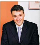
Americanii ne recomandă să accelerăm reforma în justiție și administrație