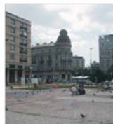
Refacerea Pieței Unirii din Iași costă peste 21 de miliarde de lei