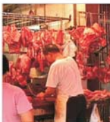
Producția de carne s-a dublat față de anii '70