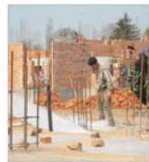
Lista de priorități pentru repartiția locuințelor ANL din sectorul 6 va fi modificată

Fără perseverență, talentul este ca un cîmp sterp. Proverb galez