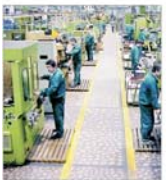
"General Electric" și "Rolls-Royce" - cei mai importanți clienți ai "Turbomecanica"