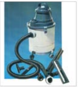
Italia - cea mai mare piață de desfacere pentru "Electroarșe"