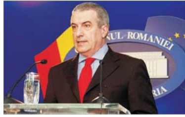
de asemenea, ca noua țintă de inflație să fie de 7,5%, peste cifra stabilită inițial, în timp ce deficitul ar urma să se situeze la nivelul de 0,7% din PIB.

Guvernul a încheiat, ieri, negocierile cu Fondul Monetar Internațional. Potrivit unor surse guvernamentale, Cabinetul Tăriceanu a căzut la pace cu reprezentanții FMI, astfel încît, în zilele următoare, cele două părți au semnat o scrisoare de intenție care premerge Memorandumul suplimentar care conștinește noile politici fiscale.