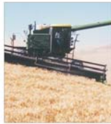
Aproape 895 milioane de euro, fonduri disponibile prin Cartea de Arșe