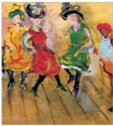
PLASAMENTE ALTERNATIVE Căldura care îngheață