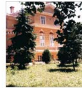
Domeniul regal de la Săvișrin va deveni un important obiectiv turistic ardean