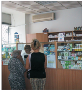
"lassyfarm" și-a dublat profitul anul trecut