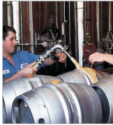
Asociația "Berarii României" a vîndut mai mult în primul semestru