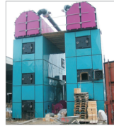
Centră pe rumeș de peste 64 miliarde lei la Viabija