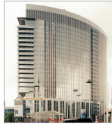
"Commerzbank" vrea să cumpere societatea de brokeraj online a grupului HVB