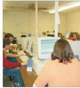
"Hewlett-Packard" elimină 10% din forța sa de muncă