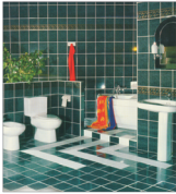
Profilul "Sanex" Cluj-Napoca s-a înscris pe un trend crescător, în ultimii ani