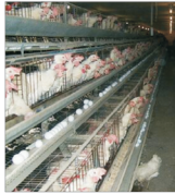
Autoritățile subvenționează în continuare carnea de pasăre