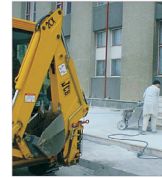
Ministerul Transporturilor va reabilita termic 26 de cladiri de locuit