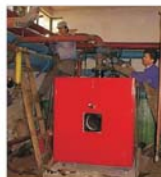
Primăria Piatra Neamț se impune pentru montarea centrelor termice