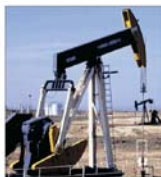
Prețul petrolului a sărit de 70 de dolari pe baril