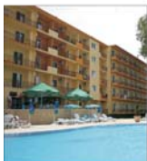
"Mazuria" finalizează o investiție de 1,8 milioane euro la hotelul "Moderna"