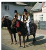
Bucovina a redevenit o destinație turistică de referință