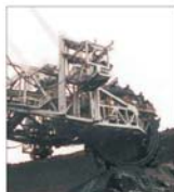
"Rotec" Buzău a trecut pe profit