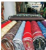
Producția de confecții din țara noastră devine interesantă pentru marii retaileri europeni