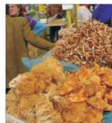
18.000 RON ca să demarezi o afacere cu ciuperci comestibile