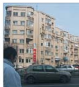
Impozitul pe veniturile imobiliare a condus la înflințarea de societăți comerciale