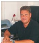
În 2006, "Metropolitan" vizează locul trei pe piața cafelei