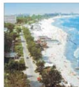
În acest sezon numărul turiștilor sosiți pe litoral a fost mai mic cu 10-15%