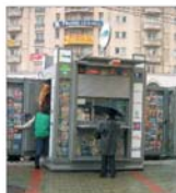
Rețeaua "Acces Press" are, în prezent, 165 chișcuiri date în funcțiune