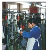
Disputa China-UE pe problema textilelor pare să fie rezolvată