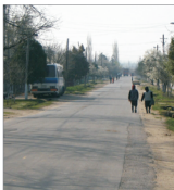
Peste 4 milioane RON vor fi investite în județul Neamț