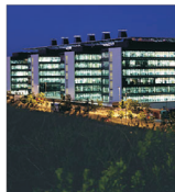
"Gas Natural" oferă circa 23 miliarde de euro pentru "Endesa"