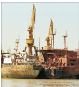
"Chimpex" Constanța a trecut pe profit