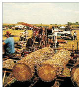
Garda Națională de Mediu a găsit amenzi care au depășit 2,8 milioane RON