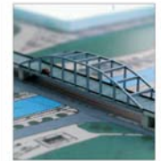
Proiectul Pasajului supratăran Basarab a fost modificat