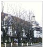
"Călimănești-Căciulata", cită de afaceri de aproape 8 milioane RON, în primul semestru