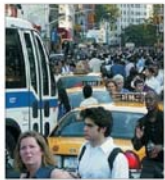
OEDC: Prețul petrolului și uraganul Katrina - șoc pentru economia mondială