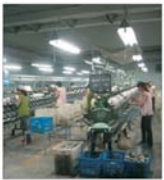
Peste 19 milioane de euro așteaptă să fie accesați în cadrul submăsurii SAPARO plante textile