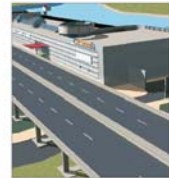
30 milioane de euro pentru "Euroamalt" Pitești