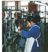
Producția industrială a Chinei, în continuă creștere