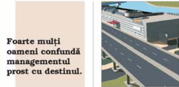
Foarte mulți oameni confundă managementul prost cu destinul.