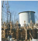
"Siborex" Focșani a avut un profit net de peste 180.000 RON, în primul semestru al anului