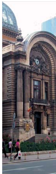
Noii bănci vor să cumpere BCR; opt bănci vor să cumpere CEC. Dintre acestea, trei figurează pe ambule liste.

Stephane Vermeire, director al departamentului de dezvoltare din cadrul "Dexia Bank", ne-a declarat că banca din Benelux este puternic dedicată obiectivului de a intra pe piața din țara noastră. Domnia sa a adăugat că "Dexia Bank" dorește să își maximizeze șansele pentru a dobîndi o poziție puternică pe piața românească, iar BCR și