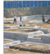
O treime din proiectul "Băneasa Investment" va fi gata anul viitor