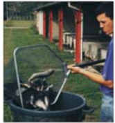
Fermele de creștere a crapului aduc profituri medii de 20.000 de euro/an