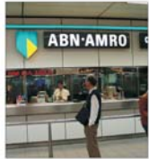
"ABN Amro" câștigă controlul la "Banca Antonveneta"