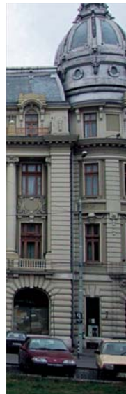
Noii bănci vor să cumpere BCR; opt bănci vor să cumpere CEC. Dintre acestea, trei figurează pe ambule liste.

CEC constituie o intrare pe piața locală.