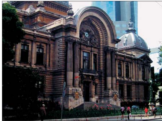
CEC are cel mai mare potențial de creștere a creditelor în valută, în urma noulor norme BNR.

• Creditul în lei ar putea deveni mai accesibil • Măsurile BNR nu pică bine unora dintre băncile străine, importatorilor și celor ce își doresc casă sau mașină pe credit